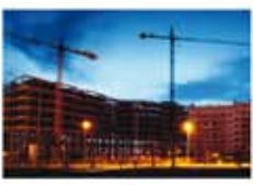
Matériaux de construction