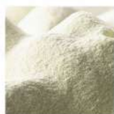
Poudre de lait